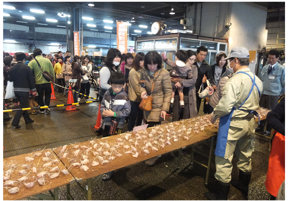
▲マダイとサワラの大試食会