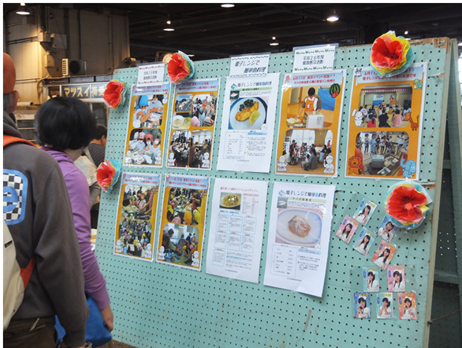
▲水産商業組合啓発ブース