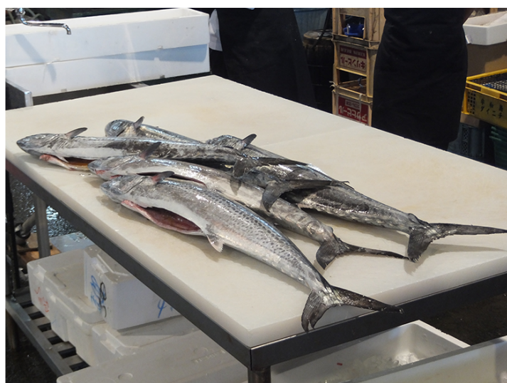
▲立派なサワラが登場！