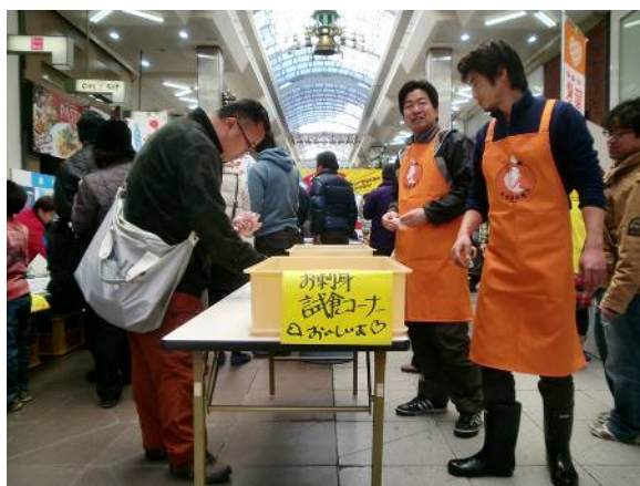
▲戸島ぶりの試食コーナー

今後もこのようなイベントを通して、愛媛のお魚をもっともっと多くの方に知っていただきたいです。