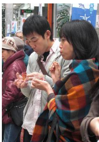
▲「南予の戸島ぶりは美味しかった。」大満足のご様子でした。

「戸島ぶり」は稚魚、飼料、出荷まで生産者で組織した共同体制で行っています。飼料も統一したものを使用して、高品質で肉質の安定した魚を育てています。戸島漁協、愛媛県漁連を通して販売し、消費者に美味しく安全な魚を届けられる体制がとられています。