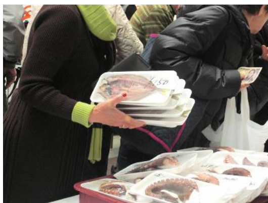
▲愛媛県産のお魚が勢ぞろい！！