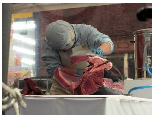
▲女子高生のマグロの解体ショー

「大街道ぐるっとグルメ海鮮市場」に参加しました。愛媛県産のお魚や水産加工品の販売に加え、お魚屋さんマップや電子レンジで簡単魚料理レシピにも、多くの方がお立ち寄り下さいました。試食コーナーでは南予の「戸島ぶり」を500食提供させていただきました。大変ご好評であったという間に終了しました。